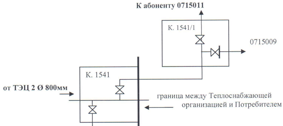
Схема присоединения Абонента Адрес: Фадеева д.4а

ОАО «МОЭК», именуемое в дальнейшем «Теплоснабжающая организация», ООО «УК «Сервис-групп» (ЦТП №0715011), именуемый в дальнейшем «Потребитель», составили настоящий акт о том, что границей балансовой принадлежности тепловых сетей и эксплуатационной ответственности сторон между Теплоснабжающей организацией и Потребителем является – наружная сторона стены камеры 1541.